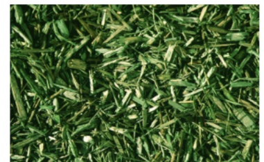
KSB – 5 grün