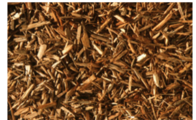
KSB – 1 zypresse-gold