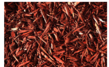
KSB – 2 redwood-rot