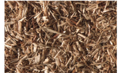
KSB – 0 naturbelassen